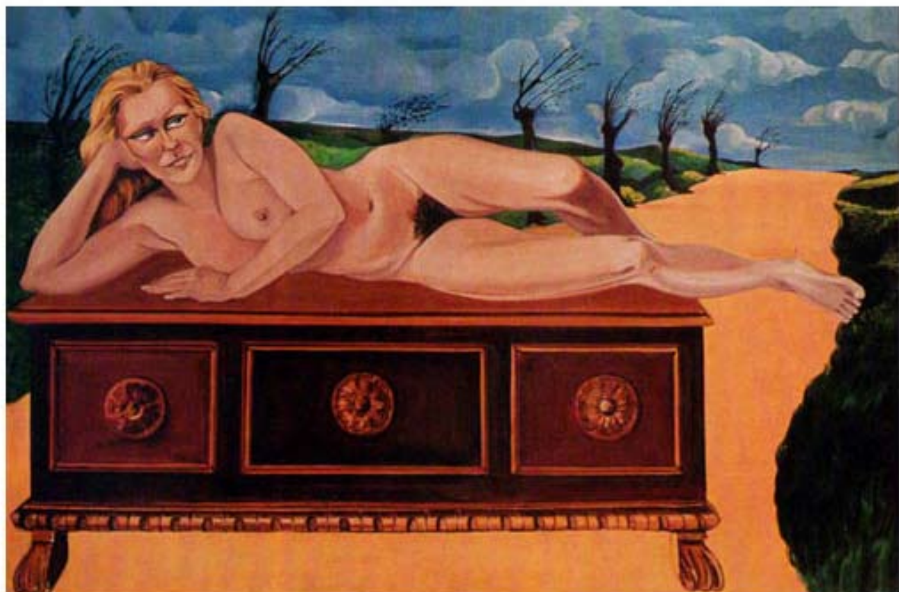
LA CASSAPANCA cm. 100x150