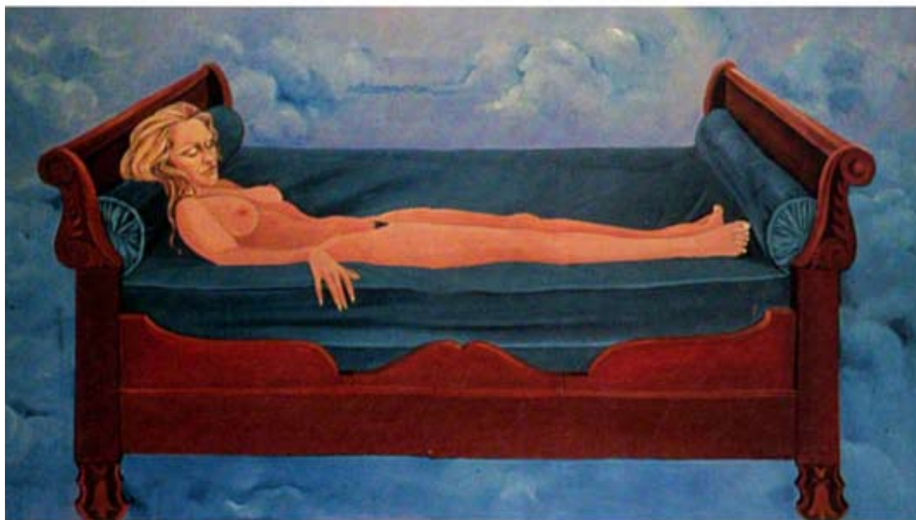
L SOGNO cm. 100x180