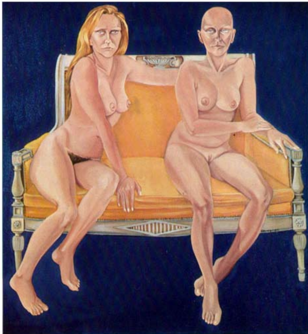
EROS cm. 125x115