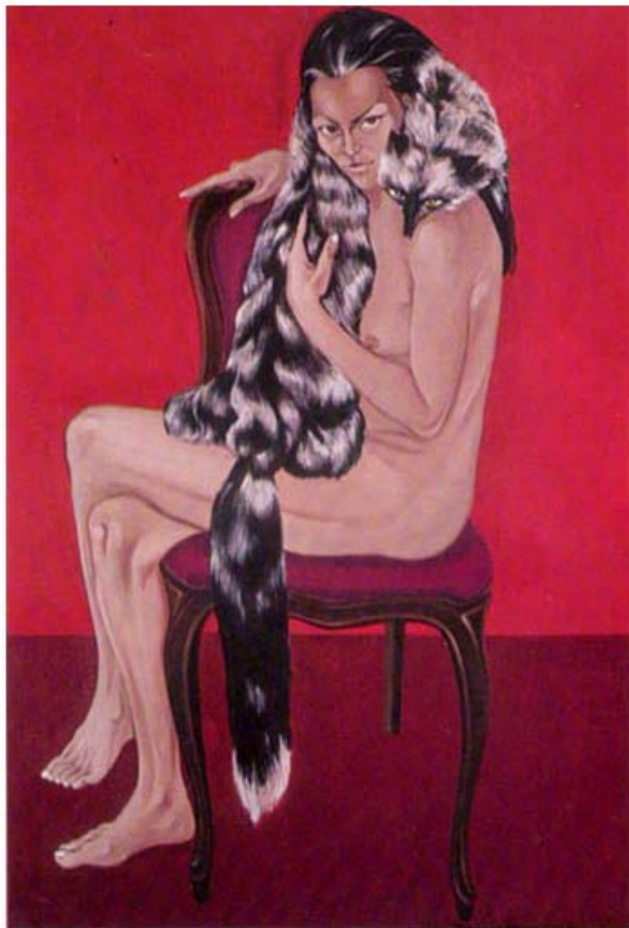
LE VOLPI cm. 150x100