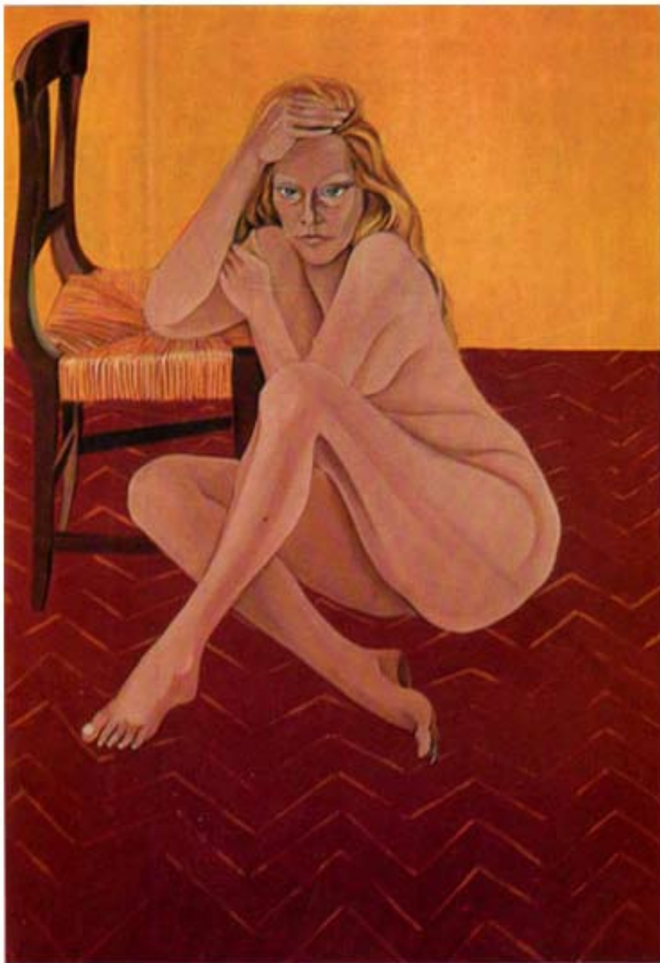
LA SEDIA cm. 130x90