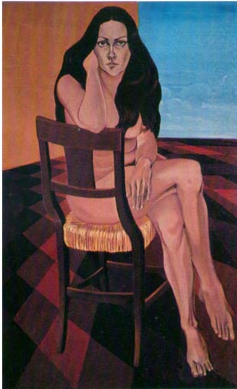
AUTORITRATTO cm. 130x80