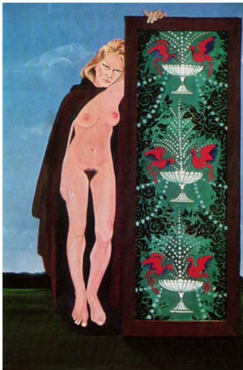
IL PARAVENTO cm. 150x100