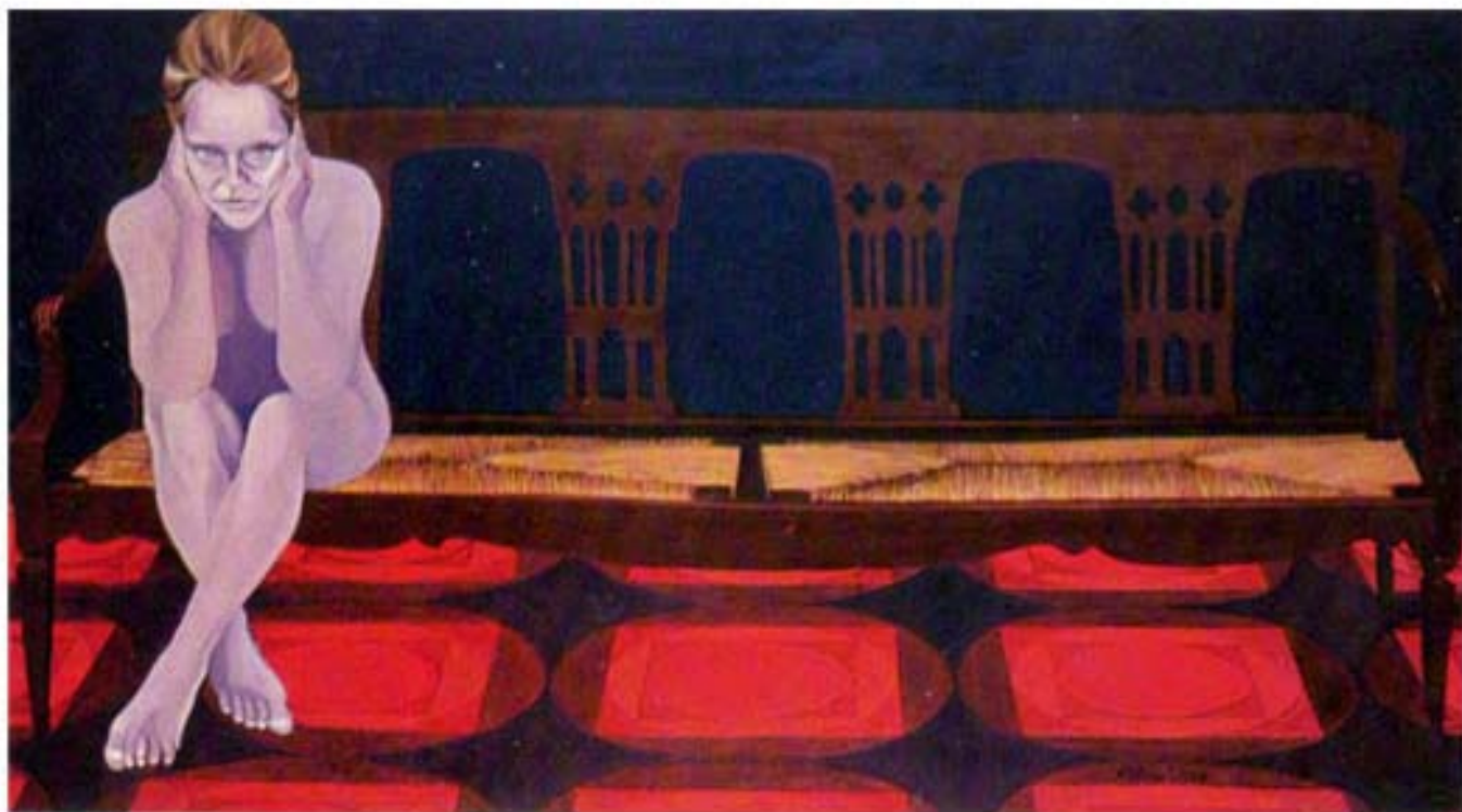
L'ANGOSCIA cm 100x180