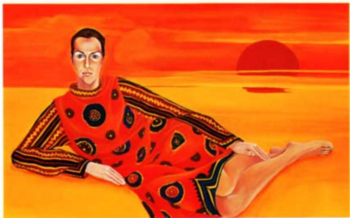
olio su tela c.,100x160 Paola