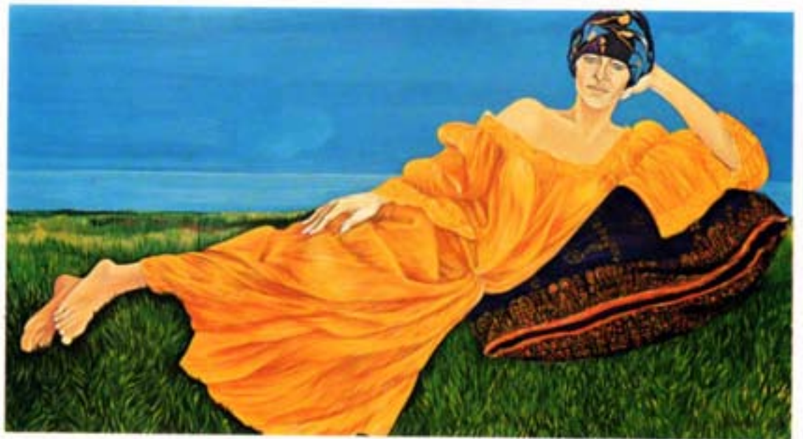
olio su tela 100x180 Teresa