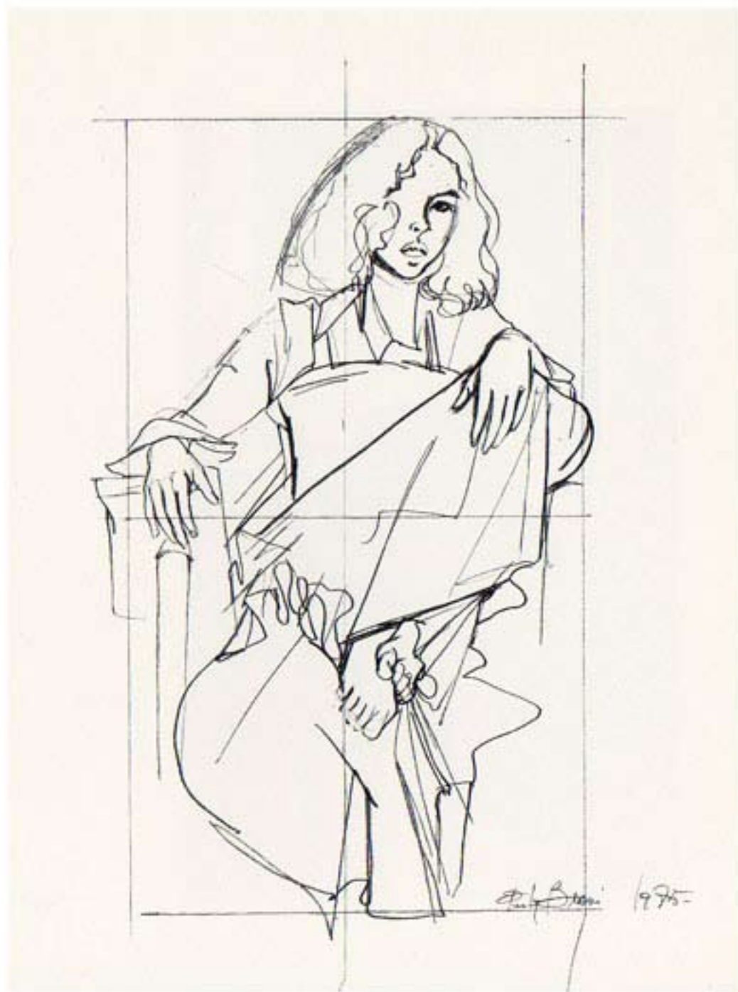
Disegno - Simona