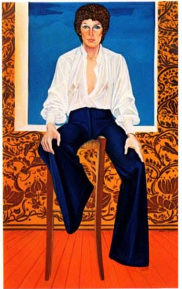
olio su tela c., 100x160 Paoletta