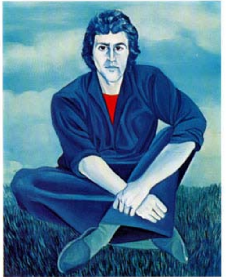
olio su tela cm.80x100 - Enzino