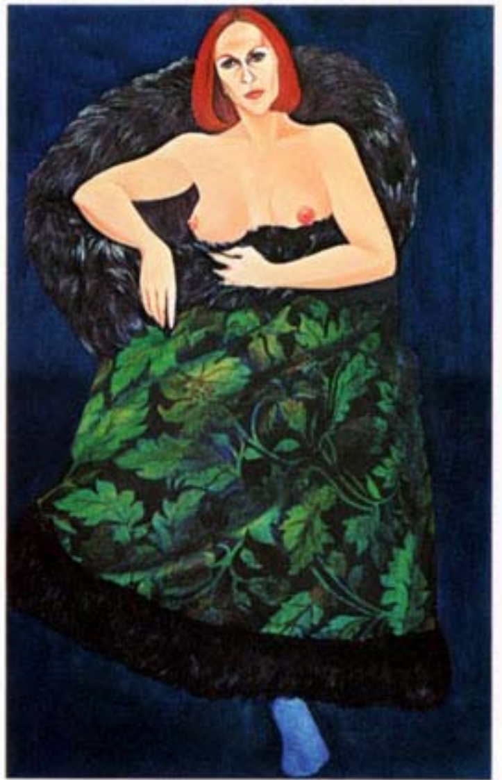
olio su tela c.,100x160 Lucetta